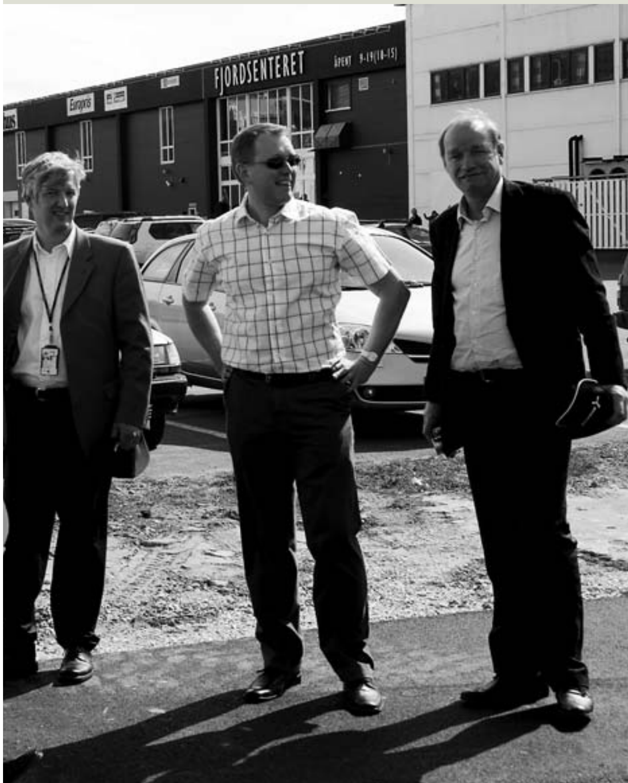
anse på Meyergården.