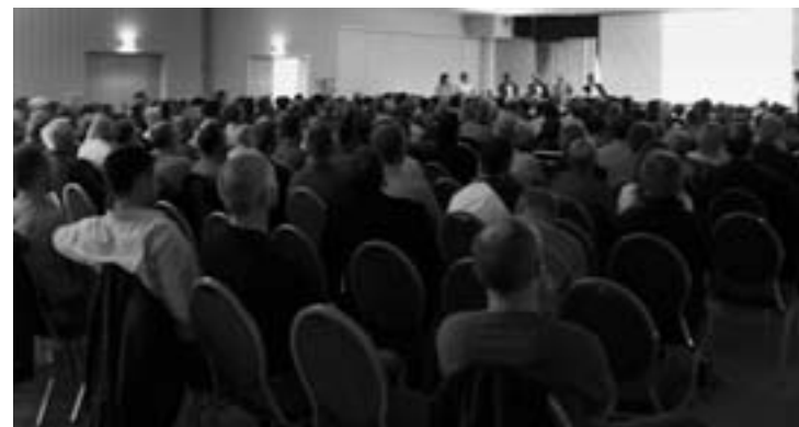
ENGASJEMENT: Det er et tydelig engasjement rundt ny storflyplass i Mo i Rana.

Panelet med dets høye kompetanse kom til Mo svevende i et helikopter etter at de hadde fått en