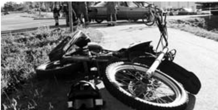
KOLLISJON: Den 16-årige føreren av denne mopeden kom bare lettere til skade etter å ha kollidert med en bil på Båsmoen fredag kveld.

Dersom det blir en storflyplass på Mo vil den bli en del av stamrutenettet som har flyginger til Oslo.