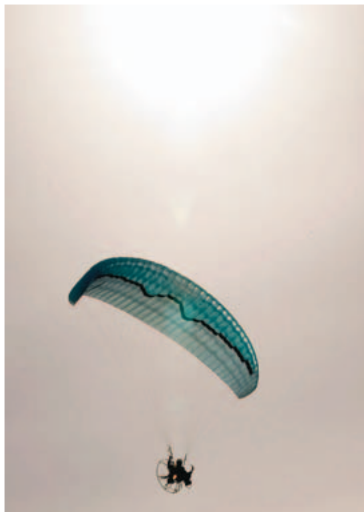
HØYT HENGER HAN: En paraglider svever i solskinnet.