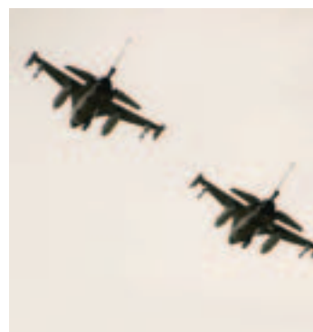
PÅ VINGENE: Forsvarets F16-fly kom innom en tur over Røssvoll.

sjon av egne fly. Willy Høgås med sitt privatfly var til stede, Notarflyet og Widerøe-fly.