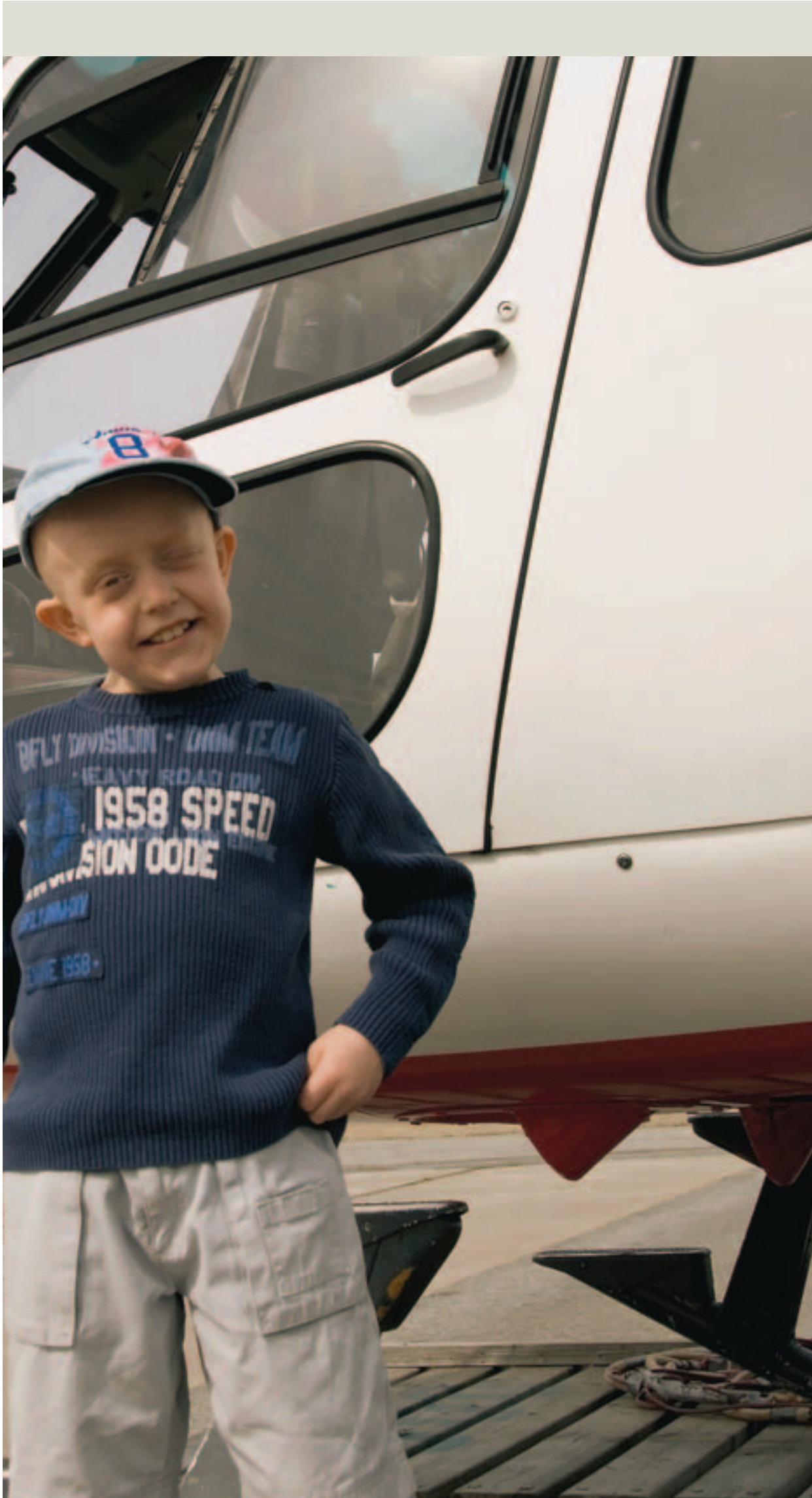
svev og store opplevelser med Helitrans helikopter.

GRUBEN: Søndag kveld mottok politiet melding om at en kvinne hadde hatt innbrudd i sin bil som sto parkert på Gruben. Innbruddet hadde skjedd i løpet av natten. Ingen skader på bilen, men ei håndveske med forskjellig innhold ble stjålet fra bilen. Politiet er interessert i tips dersom publikum har sett noe.